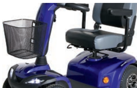
La corbeille amovible à l'avant est d'une grande capacité, pour vos achats par exemple.