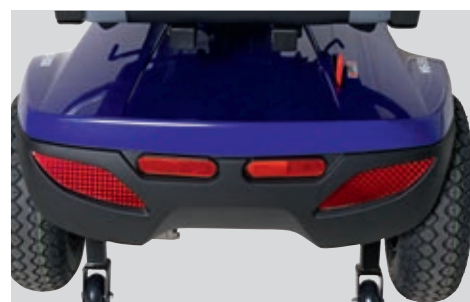
Feux et catadioptrés assurent une excellente visibilité.