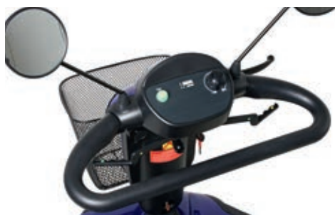
Commande facile à bascule et bouton de réglage de vitesse en continu.

angulairement et peut être parfaitement adaptée aux besoins de l'utilisateur. Le tableau de contrôle est intégré dans la colonne de direction, avec des touches surélevées. Après la pression sur une touche, un signal sonore retentit et confirme le choix effectué.