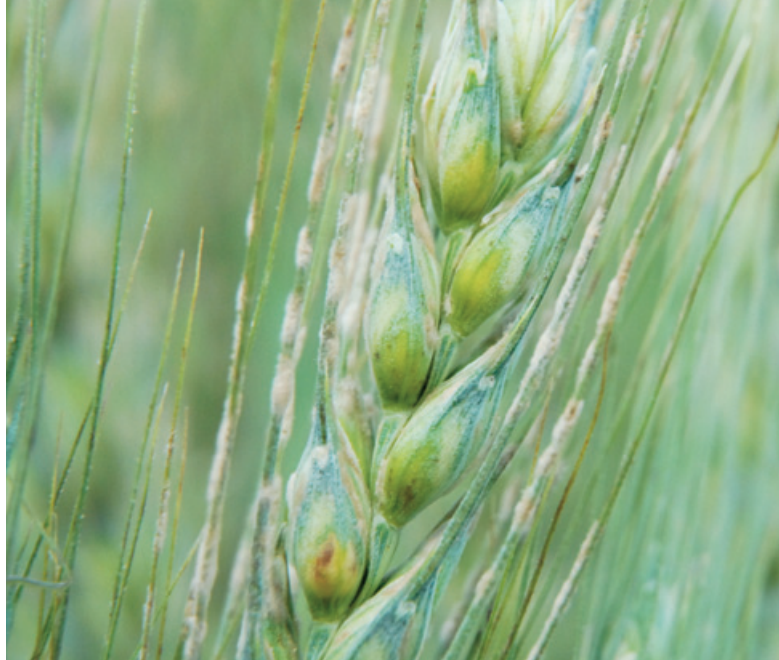
Mehltau auf der Ähre einer sehr anfälligen Weizensorte.

Keimung der Sporen. Systemische Fungizide hemmen die Bildung der Sporen und können auch das Eindringen und das Wachstum im Blatt hemmen. Die pflanzeigenen Resistenzen blockieren den Krankheitserreger und verhindern dessen Eindringen. Die Abwehrreaktion läuft nach folgendem Schema ab: Zunächst muss der potentielle Eindringling erkannt werden. Danach werden verschiedene Abwehrmassnahmen eingeleitet. Auf der einen Seite werden Stoffe hergestellt, die den Pathogen hemmen oder schädigen, sogenannte Phytoalexine, sowie Barrieren aufgebaut, die der Pathogen nur schwer überwinden kann. Die betroffenen Zellen können auch einen sogenannten programmierten Zelltod einleiten. Bei dieser hypersensiblen Reaktion sterben die Zellen ab, in welche der Pilz eingedrungen ist. Sterbende Zellen bilden ebenfalls verschiedene Giftstoffe, ausserdem werden die Zellwände verdickt und verholzt. Dies ist die effizienteste Methode der Pflanze, um den Eindringling einzudämmen und an der weiteren Ausbreitung zu hindern.