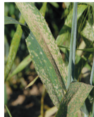
In Einzelfällen kann der Echte Mehltau durch den Assimilationsverlust zu Ertragsausfällen von 10% und mehr führen.

Fazit Es gibt keine isolierte Methode zur Mehltaubekämpfung im Getreide. Eine dauerhafte Bekämpfungsstrategie gegen den Echten Mehltau muss den Lebenszyklus des Pilzes und seine Anpassungsfähigkeit berücksichtigen und die vorhandenen Mittel gezielt umsetzen. Dazu können moderne Methoden aus den Pflanzenwissenschaften beitragen, aber auch bekannte Massnahmen wie geringe Stickstoffgaben und eine geringe Saaddichte. Die Kombination der vorhandenen Methoden erlaubt es, Kosten zu sparen und einen nachhaltigen Pflanzenschutz zu betreiben. Der integrierte Ackerbau hat hier schon grosse Fortschritte gemacht, kann und muss aber noch weiterentwickelt werden. ■