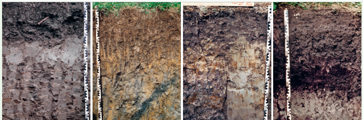
Boden auf Mergel-Terrasse im Jura (Pseudogley).

Gleye und Moorböden sind vor allem in Mulden und bei Hangwasseraustritten anzutreffen. Oft haben sie einen humusreichen, anmoorigen bis torfigen Oberboden. Ist die Torfschicht mächtiger als 40 cm, spricht man von Moorböden. Bei drainierten, intensiv bearbeiteten Moorböden nimmt die Mächtigkeit der Torfschicht wegen des Humusabbaus kontinuierlich ab (Torfsackung).