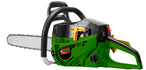
(Art. Nr. 19695.01)