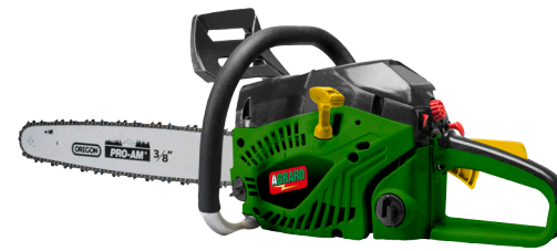
(Art. Nr. 19694.01)