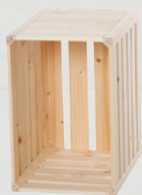
3 Cagette A 1/3 35 × 23,5 × 32 cm No. d'art. 74712