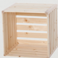
2 Cagette A 1/2 35 × 35 × 32 cm No. d'art. 74711