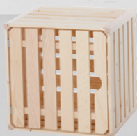
6 Cagette avec porte A 1/2 35 × 35 × 32 cm No. d'art. 74708