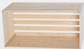
1 Cagette A 1/1 70 × 35 × 32 cm No. d'art. 74710