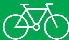
Bicyclettes et vélos électriques

En plus des trottinettes et vélos, nous proposons des services d'entretien pour: