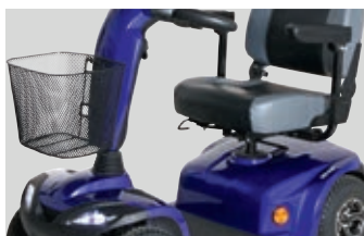
La corbeille amovible à l'avant est d'une grande capacité, pour vos achats par exemple.