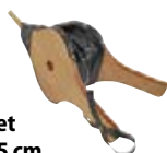
Soufflet 40 × 15 cm 64307