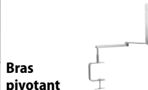
Bras pivotant double a.support 77760