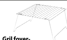
Gril foyer- barbecue 28 × 28 cm 81273